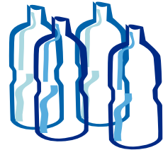
Botellas de litro de plástico transparente